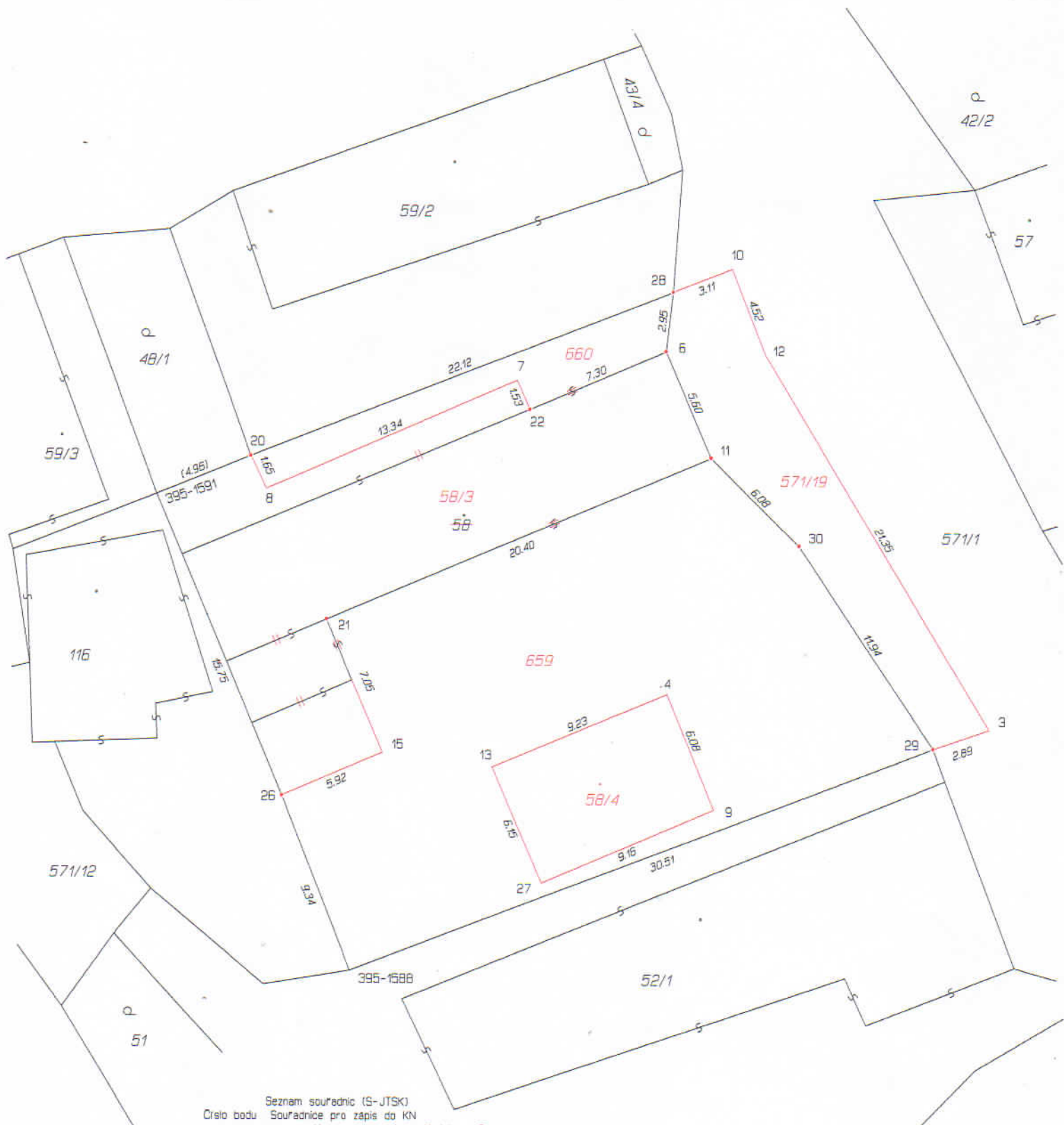
Seznam souřadnic (S-JTSK) Číslo bodu Souřadnice pro zápis do KN Y X Kód kv. Poznámka