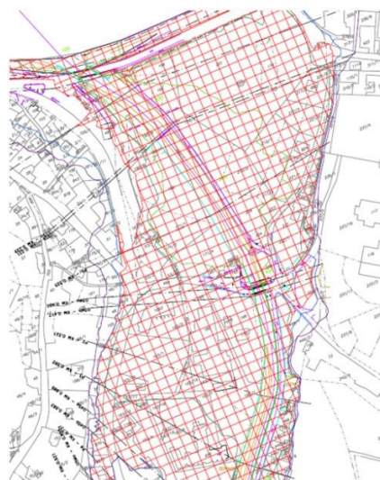
návrh aktivní zóny

Správce vodního toku musí při návrhu záplavového území vycházet z výše uvedené vyhlášky a územní plán po vydání opatření obecné povahy jej musí akceptovat. Návrh záplavového území nelze přizpůsobovat stávajícím územním plánům nebo budoucímu využití území.